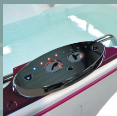
Mitigeur Rada Sense