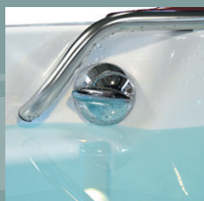
Commande de vidange