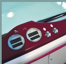
Afficheurs de température