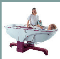
Modèle avec option piètement