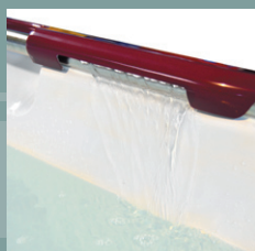
Remplissage de type «Cascade»